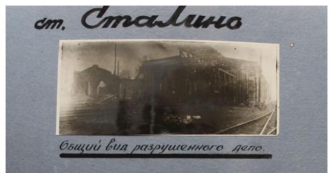
Страницы из альбома о зверствах нацистских оккупантов в Донбассе