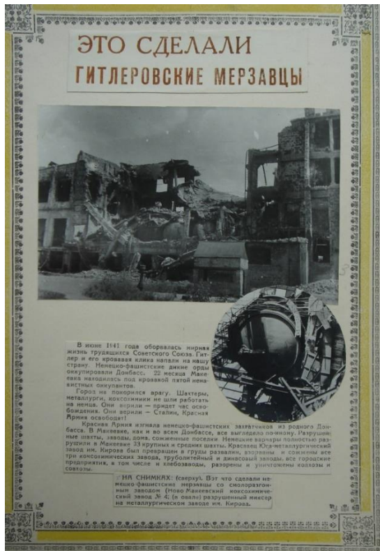
Страница из альбома «Макеевка. Ко второй годовщине освобождения Донбасса от немецко-фашистских захватчиков»

Такие фотоальбомы создавались и в других регионах Советского Союза, которые были в оккупации. В них также представлены фотоматериалы с описанием ущерба, нанесенного нацистами.